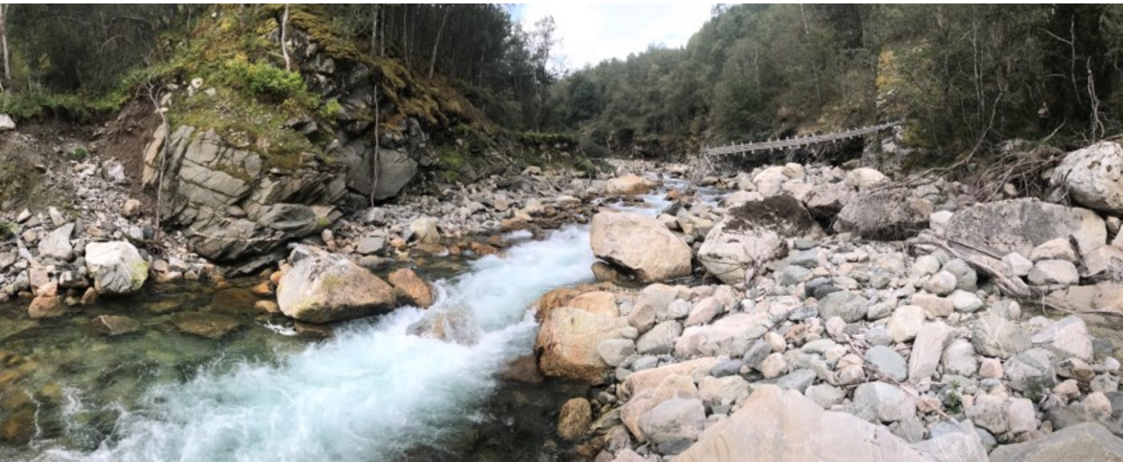
Vasstaket, inntaksområde for Mork kraftverk